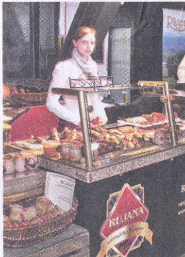
Regionale Spezialitäten wie hier Fleisch- und Wurstwaren wurden auf der Messe gezeigt.

Rügener Produktemesse in der Stralsunder Brauerei